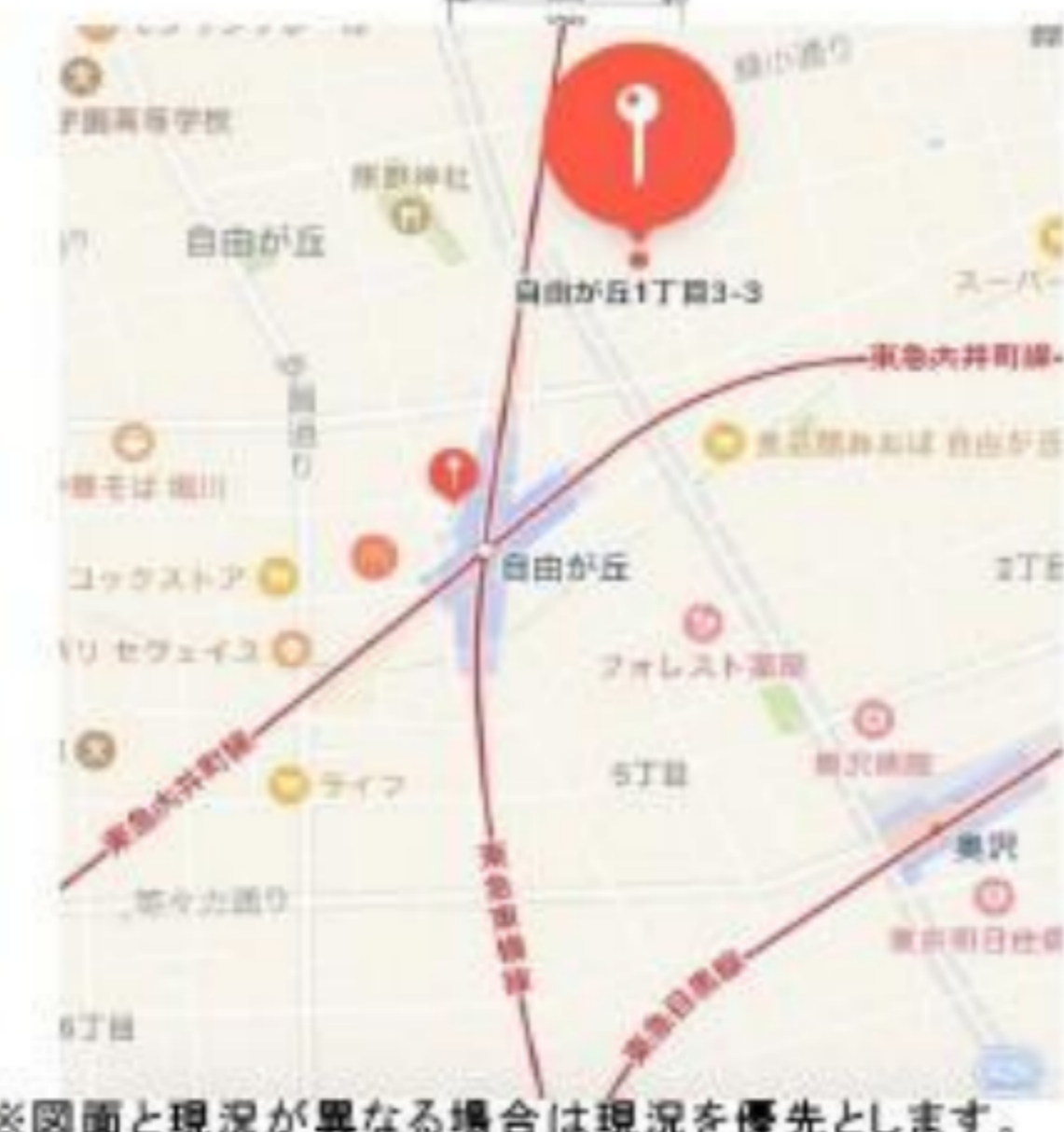
※図面と現況が異なる場合は現況を優先とします。